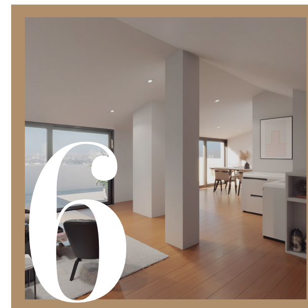
CLIMATIZACIÓN Y VENTILACIÓN | CLIMATITZACIÓ I VENTILACIÓ