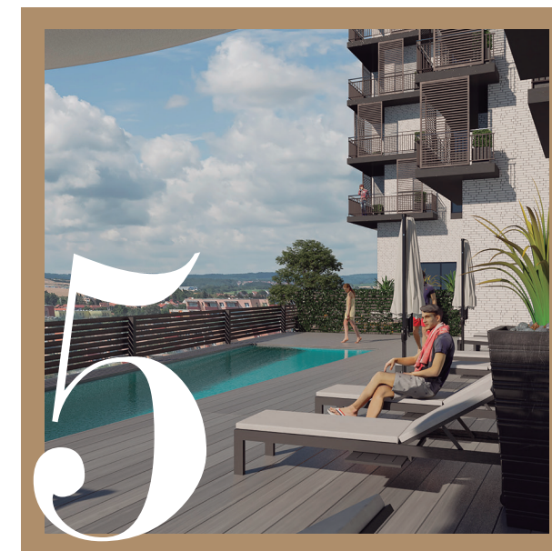
ZONAS COMUNES | ZONES COMUNS