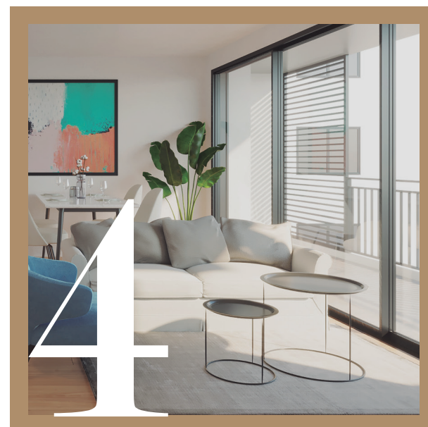
ACABADOS | ACABATS