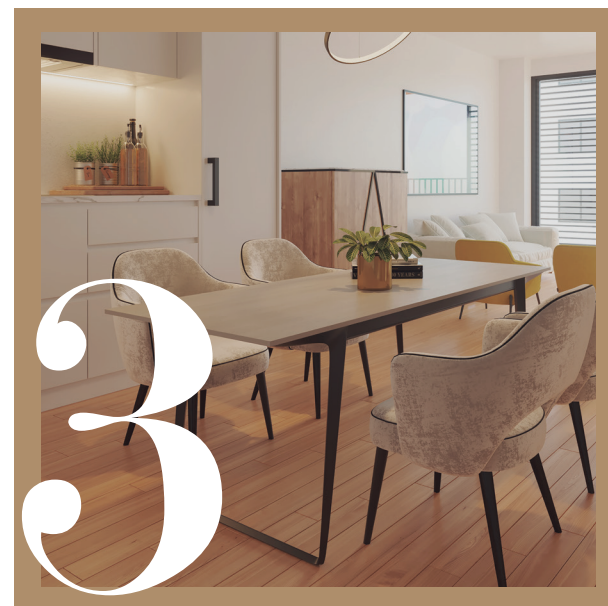
COCINAS | CUINES