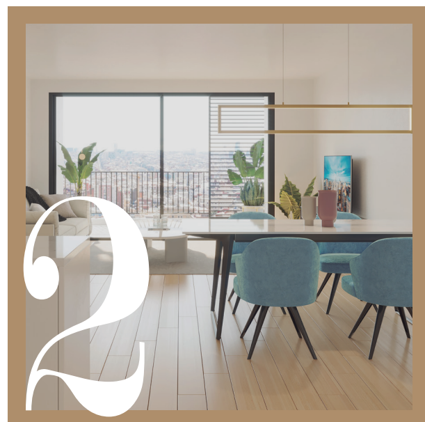
DISEÑO | DISSENY